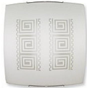
O1465 ↔ 8 cm ↔ 40 cm I 40 cm 2xE27 max 60W