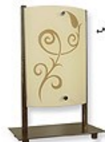
O1458 H 20x12 cm Ø 30 cm 1xE27 max 60W