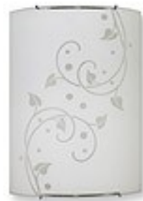
O1442 H 7 cm H 21 cm I 29 cm 1xE27 max 60W