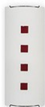
O1551 ↔ 7 cm ↔ 15 cm ↓ 38 cm 2xE27 max 60W