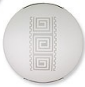
O1466 ↔ 7 cm Ø 30 cm 1xE27 max 60W