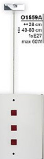
O1559A ↔ 28 cm ↔ 40-80 cm 1xE27 max 60W