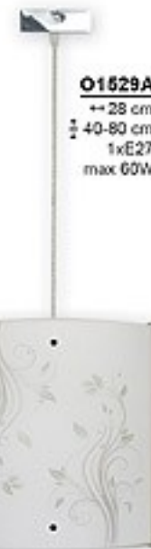
O1529A ↔ 28 cm ↔ 40-80 cm 1xE27 max 60W