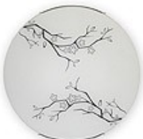
O1546 ↔ 7 cm Ø 30 cm 1xE27 max 60W