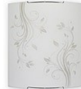
O1523 ↔ 7 cm ↔ 27 cm I 30 cm 1xE27 max 60W