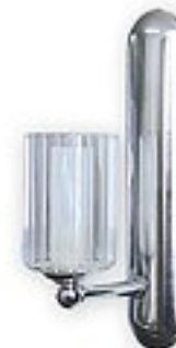
550/K1 H= 11 cm H= 6 cm Ø 24 cm 1xG9 max 40W