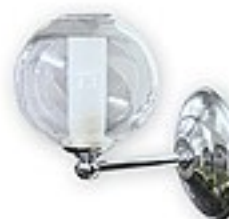
551/K1 H= 17 cm H= 12 cm Ø 20 cm 1xG9 max 40W