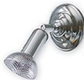
209/K1 H= 11-17 cm H= 10 cm Ø 10-16 cm 1xE14 max 40W