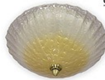
O05/K2 K_10 ↔ 15 cm Ø 30 cm 2xE27 max 60W