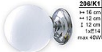
206/K1 H= 16 cm H= 12 cm Ø 12 cm 1xE14 max 40W