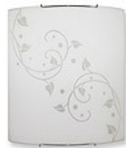
O1443 H 7 cm H 27 cm I 30 cm 1xE27 max 60W