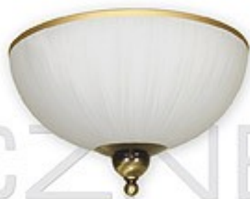
O1481 PAT H= 15 cm Ø 30 cm 2xE27 max 60W