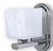
557KG/K1 H= 14 cm H= 9 cm Ø 16 cm 1xE14 max 40W