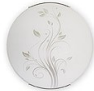
O1526 ↔ 7 cm Ø 30 cm 1xE27 max 60W