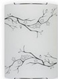
O1542 ↔ 7 cm ↔ 21 cm I 29 cm 1xE27 max 60W