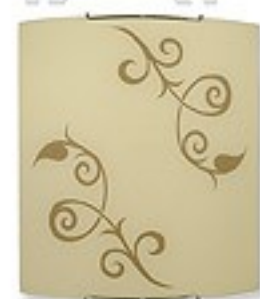
O1453 H 7 cm H 27 cm I 30 cm 1xE27 max 60W