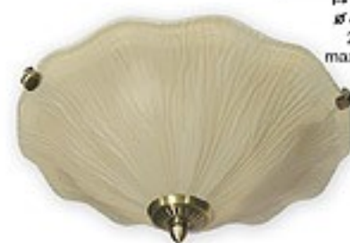
O05/K2 K_1 ↔ 16 cm Ø 40 cm 2xE27 max 60W