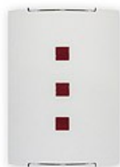
O1552 ↔ 7 cm ↔ 21 cm ↓ 29 cm 1xE27 max 60W