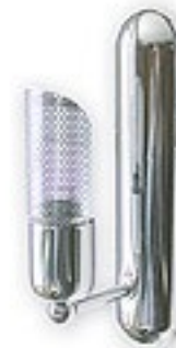
207/K1 H= 10 cm H= 6 cm Ø 24 cm 1xE14 max 40W