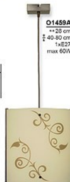
O1459A H 20 cm I 40-80 cm 1xE27 max 60W