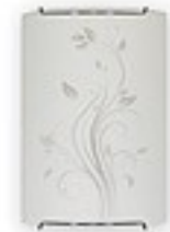
O1520 ↔ 8 cm ↔ 15 cm I 22 cm 1xE27 max 60W