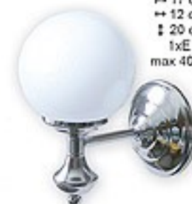
202/K1 H= 17 cm H= 12 cm Ø 20 cm 1xE14 max 40W