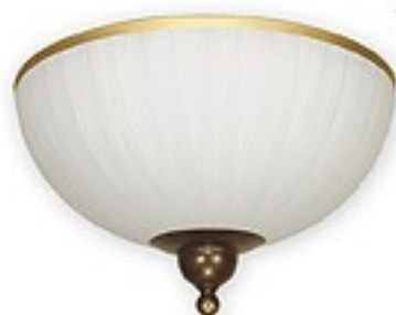
O1481 BR H= 15 cm Ø 30 cm 2xE27 max 60W