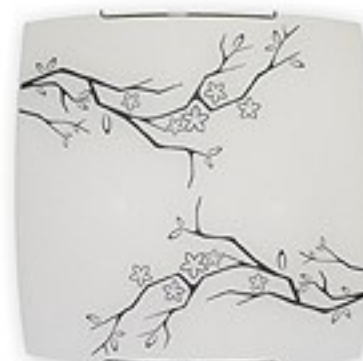
O1545 ↔ 8 cm ↔ 40 cm I 40 cm 2xE27 max 60W