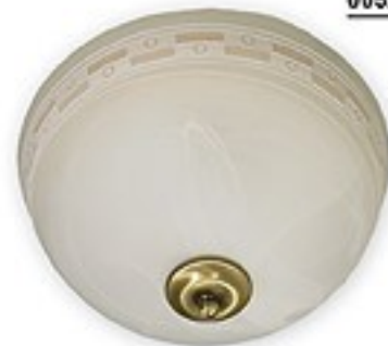
005/K2 K_12 H= 18 cm Ø 30 cm 2xE27 max 60W