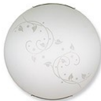
O1447 H 8 cm Ø 40 cm 2xE27 max 60W