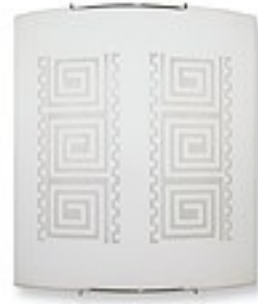
O1463 ↔ 7 cm ↔ 27 cm I 30 cm 1xE27 max 60W