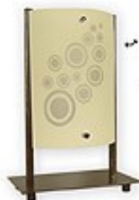
O1538 ↔ 20x12 cm I 30 cm 1xE27 max 60W