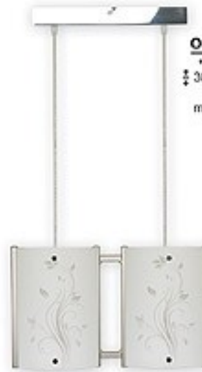
O1529B ↔ 36 cm ↔ 30-70 cm 2xE27 max 60W