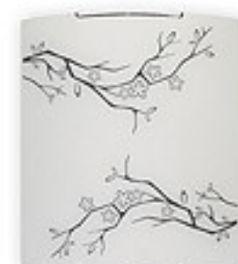
O1543 ↔ 7 cm ↔ 27 cm I 30 cm 1xE27 max 60W