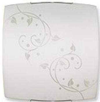
O1445 H 8 cm H 40 cm I 40 cm 2xE27 max 60W