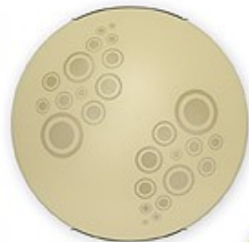
O1537 ↔ 8 cm Ø 40 cm 2xE27 max 60W