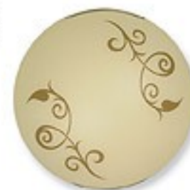
O1456 H 7 cm Ø 30 cm 1xE27 max 60W