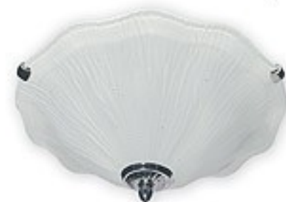
O05/K2 K_2 ↔ 16 cm Ø 40 cm 2xE27 max 60W