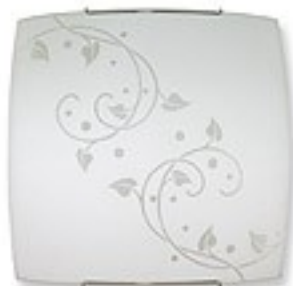
O1444 H 7 cm H 30 cm I 30 cm 1xE27 max 60W