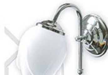
200/K1 H= 20 cm H= 10 cm Ø 17 cm 1xE14 max 40W