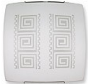
O1464 ↔ 7 cm ↔ 30 cm I 30 cm 1xE27 max 60W