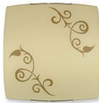
O1455 H 8 cm H 40 cm I 40 cm 2xE27 max 60W