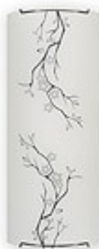
O1541 ↔ 7 cm ↔ 15 cm I 36 cm 2xE27 max 60W