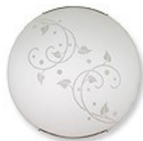
O1446 H 7 cm Ø 30 cm 1xE27 max 60W