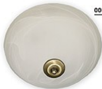
005/K2 K_17 H= 18 cm Ø 30 cm 2xE27 max 60W