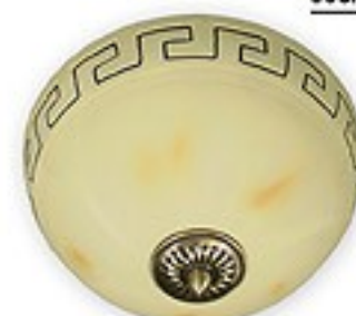
O05/K2 K_14 ↔ 18 cm Ø 30 cm 2xE27 max 60W