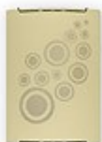
O1530 ↔ 8 cm ↔ 15 cm I 22 cm 1xE27 max 60W