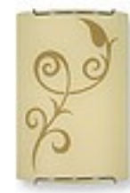
O1450 H 8 cm H 15 cm I 22 cm 1xE27 max 60W