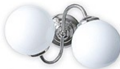
201/K2 H= 15 cm H= 28 cm Ø 17 cm 2xE14 max 40W