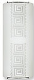
O1461 ↔ 7 cm ↔ 15 cm I 36 cm 2xE27 max 60W