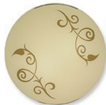
O1457 H 8 cm Ø 40 cm 2xE27 max 60W