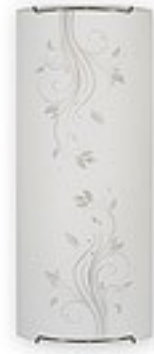
O1521 ↔ 7 cm ↔ 15 cm I 36 cm 2xE27 max 60W