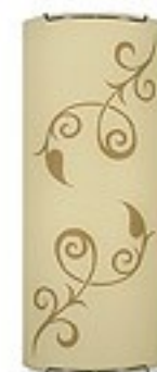
O1451 H 7 cm H 15 cm I 36 cm 2xE27 max 60W