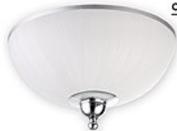
O1481 CH H= 15 cm Ø 30 cm 2xE27 max 60W