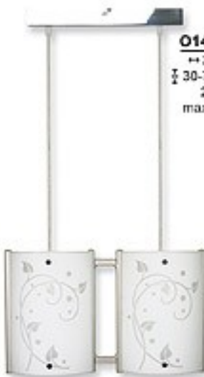
O1449B H 36 cm I 30-70 cm 2xE27 max 60W