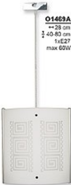
O1469A ↔ 28 cm ↔ 40-80 cm 1xE27 max 60W