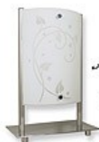
O1448 H 20x12 cm I 30 cm 1xE27 max 60W