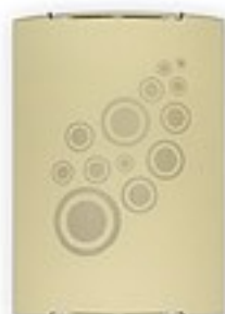
O1532 ↔ 7 cm ↔ 21 cm I 29 cm 1xE27 max 60W