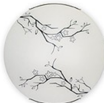
O1547 ↔ 8 cm Ø 40 cm 2xE27 max 60W