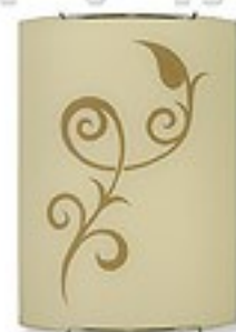
O1452 H 7 cm H 21 cm I 20 cm 1xE27 max 60W