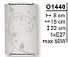
O1440 H 8 cm H 15 cm I 22 cm 1xE27 max 60W