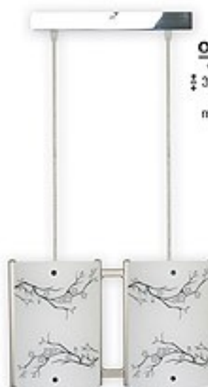
O1549B ↔ 36 cm ↔ 30-70 cm 2xE27 max 60W