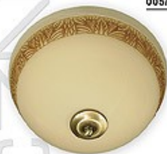
O05/K2 K_13 ↔ 15 cm Ø 30 cm 2xE27 max 60W