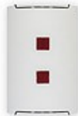
O1550 ↔ 8 cm ↔ 15 cm ↓ 22 cm 1xE27 max 60W