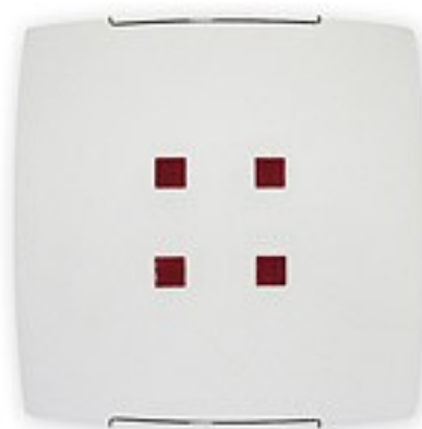
O1555 ↔ 8 cm ↔ 40 cm ↓ 40 cm 2xE27 max 60W