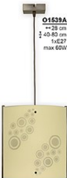
O1539A ↔ 28 cm ↔ 40-80 cm 1xE27 max 60W