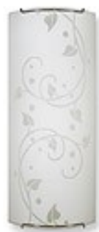
O1441 H 7 cm H 15 cm I 36 cm 2xE27 max 60W