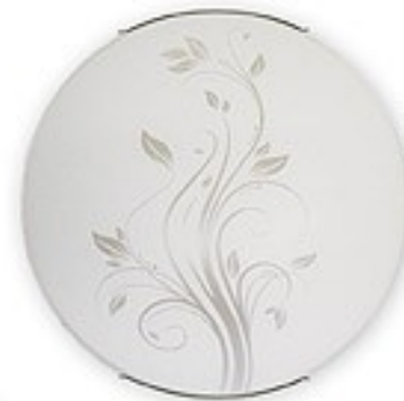
O1527 ↔ 8 cm Ø 40 cm 2xE27 max 60W