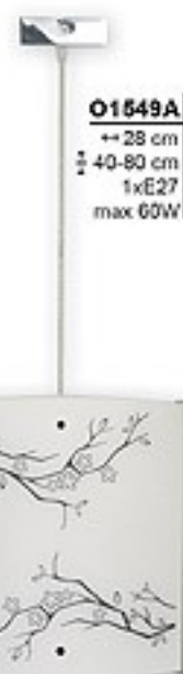
O1549A ↔ 28 cm ↔ 40-80 cm 1xE27 max 60W