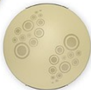
O1536 ↔ 7 cm Ø 30 cm 1xE27 max 60W