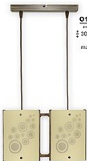
O1539B ↔ 36 cm ↔ 30-70 cm 2xE27 max 60W