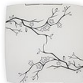
O1544 ↔ 7 cm ↔ 30 cm I 30 cm 1xE27 max 60W