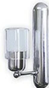
552/K1 H= 11 cm H= 6 cm Ø 24 cm 1xE14 max 40W