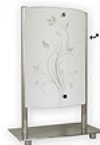
O1528 ↔ 20x12 cm I 30 cm 1xE27 max 60W