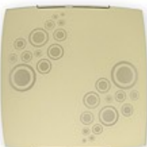
O1534 ↔ 7 cm ↔ 30 cm I 30 cm 1xE27 max 60W