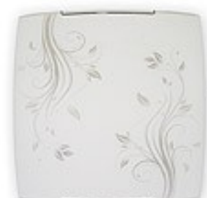
O1524 ↔ 7 cm ↔ 30 cm I 30 cm 1xE27 max 60W