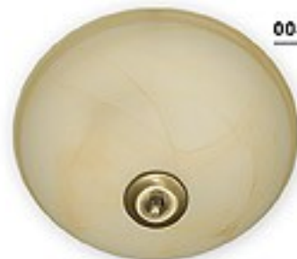
005/K2 K_16 H= 18 cm Ø 30 cm 2xE27 max 60W