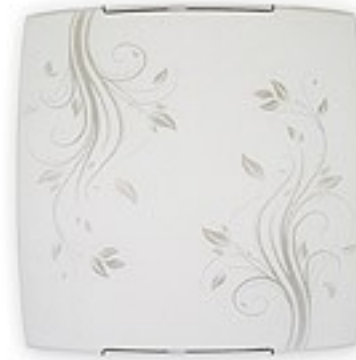
O1525 ↔ 8 cm ↔ 40 cm I 40 cm 2xE27 max 60W