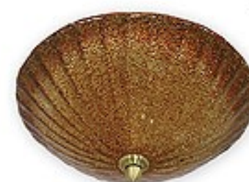
O05/K2 K_9 ↔ 15 cm Ø 30 cm 2xE27 max 60W