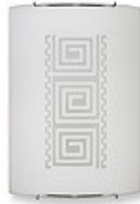
O1462 ↔ 7 cm ↔ 21 cm I 29 cm 1xE27 max 60W