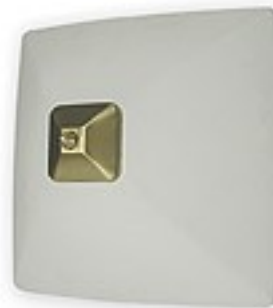
O05/K2 K_7 ↔ 15 cm ↔ 27x27 cm 2xE27 max 60W