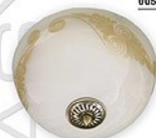
O05/K2 K_11 ↔ 12 cm Ø 30 cm 2xE27 max 60W