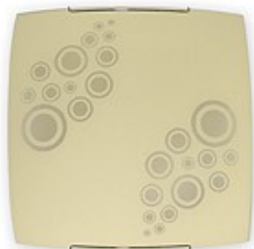
O1535 ↔ 8 cm ↔ 40 cm I 40 cm 2xE27 max 60W