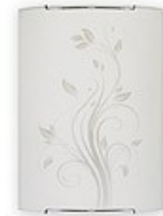
O1522 ↔ 7 cm ↔ 21 cm I 29 cm 1xE27 max 60W