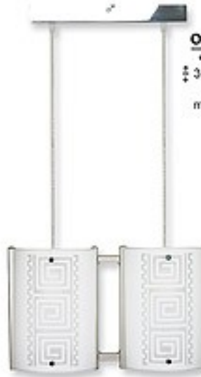
O1469B ↔ 36 cm ↔ 30-70 cm 2xE27 max 60W