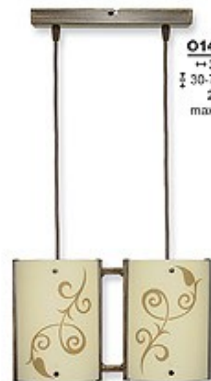
O1459B H 36 cm I 30-70 cm 2xE27 max 60W