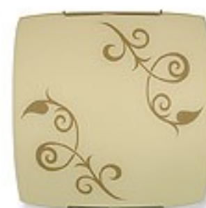
O1454 H 7 cm H 30 cm I 30 cm 1xE27 max 60W