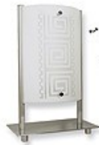
O1468 ↔ 20x12 cm I 30 cm 1xE27 max 60W