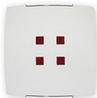
O1554 ↔ 7 cm ↔ 30 cm ↓ 30 cm 1xE27 max 60W