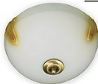
005/K2 K_15 H= 15 cm Ø 30 cm 2xE27 max 60W