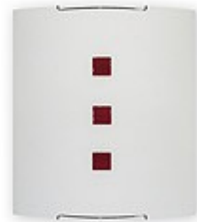
O1553 ↔ 7 cm ↔ 27 cm ↓ 30 cm 1xE27 max 60W