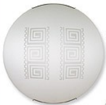
O1467 ↔ 8 cm Ø 40 cm 2xE27 max 60W