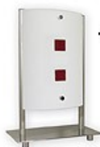
O1558 ↔ 20x12 cm ↓ 30 cm 1xE27 max 60W