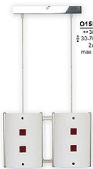
O1559B ↔ 36 cm ↔ 30-70 cm 2xE27 max 60W