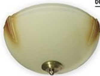
005/K2 K_6 H= 15 cm Ø 30 cm 2xE27 max 60W