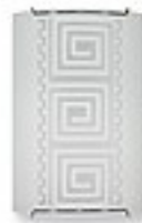
O1460 ↔ 8 cm ↔ 15 cm I 22 cm 1xE27 max 60W