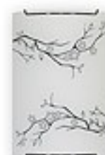
O1540 ↔ 8 cm ↔ 15 cm I 22 cm 1xE27 max 60W