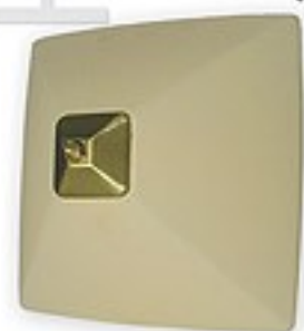
O05/K2 K_8 ↔ 15 cm ↔ 27x27 cm 2xE27 max 60W