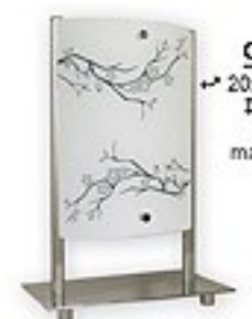
O1548 ↔ 20x12 cm I 30 cm 1xE27 max 60W