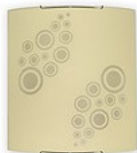
O1533 ↔ 7 cm ↔ 27 cm I 30 cm 1xE27 max 60W