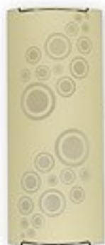
O1531 ↔ 7 cm ↔ 15 cm I 36 cm 2xE27 max 60W