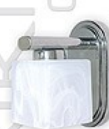
556KD/K1 H= 14 cm H= 9 cm Ø 16 cm 1xE14 max 40W